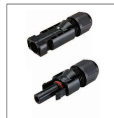
Standard4 connectors / Standard4 Verbinder